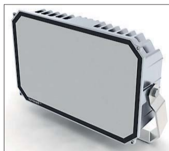
PROTOTYP. Lyskasteren er bygd opp av lysdioder og en egen optikk som til sammen gir svært kraftig lys.

– Som sunnmøring så var det naturlig å prøve den vegen, sier han.